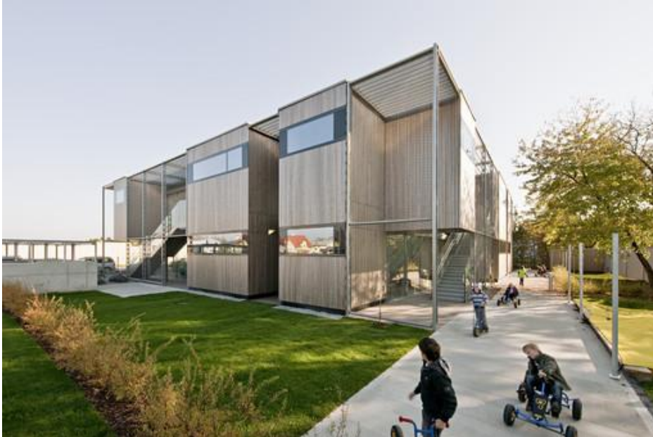
Kindergarten Schukowitzgasse 85, 1220 Wien : Das im Herbst 2010 in Betrieb genommene Gebäude ging als Siegerprojekt aus einem offenen Wettbewerb hervor.