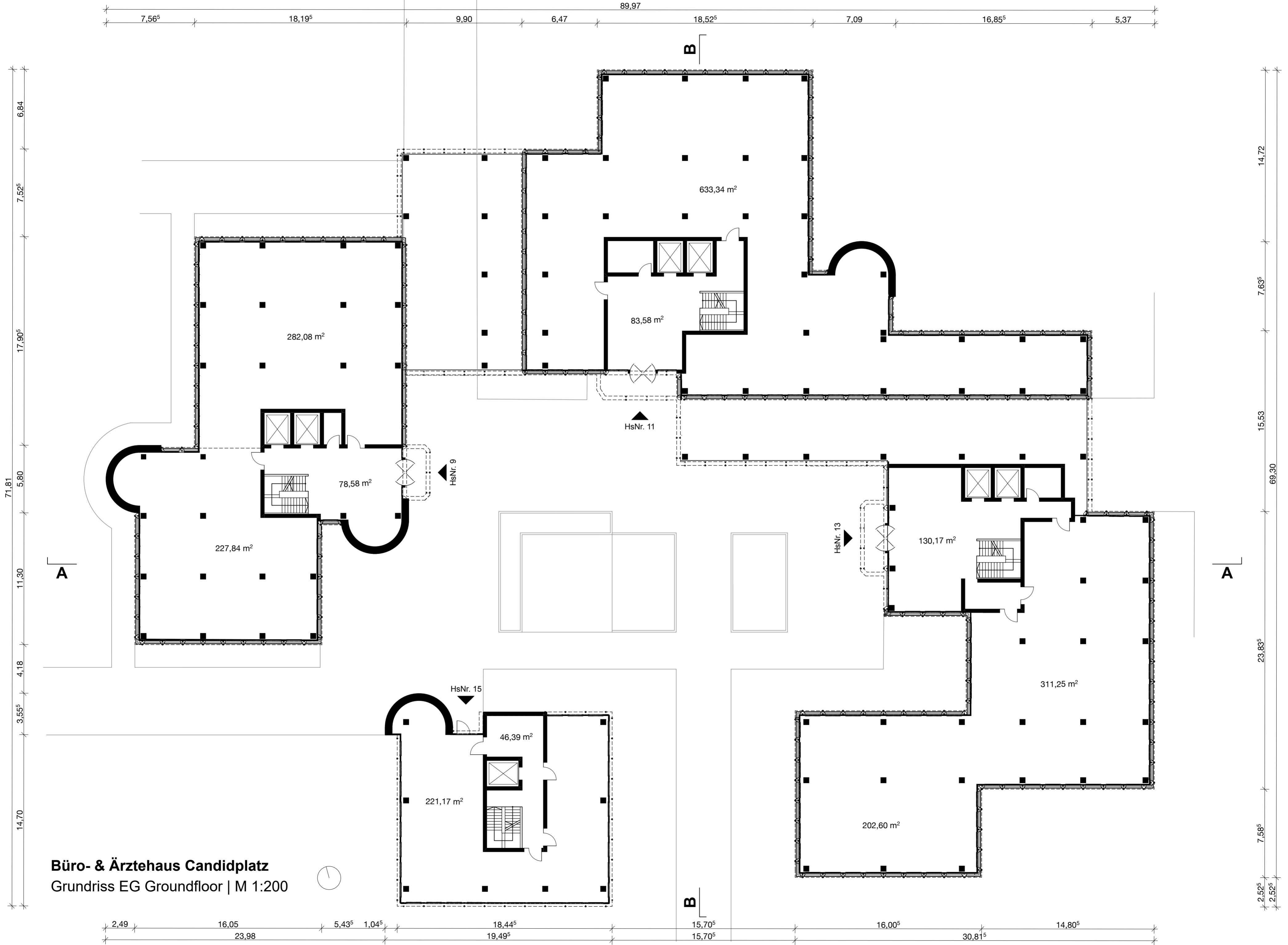
Büro- & Ärztehaus Candidplatz Grundriss EG Groundfloor | M 1:200